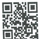
QR CODE แบบฟอร์ม

กลุ่มงานสืบสวนสอบสวนและพรรคการเมือง สำนักงานคณะกรรมการการเลือกตั้งประจำจังหวัดสกลนคร