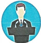
1. ผู้สมัคร