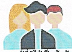
3. ผู้ที่มีได้เป็นผู้สมัคร

สามารถใช้วิธีการหาเสียงเลือกตั้งทางอิเล็กทรอนิกส์ได้ด้วยตนเอง หรือมอบหรือว่าจ้างบุคคลหรือนิติบุคคลดำเนินการแทนได้